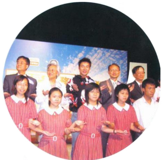
主禮嘉賓及學生一起做出「放低歧視與偏見」的手勢，呼籲所有人合力締造平等機會的校園。